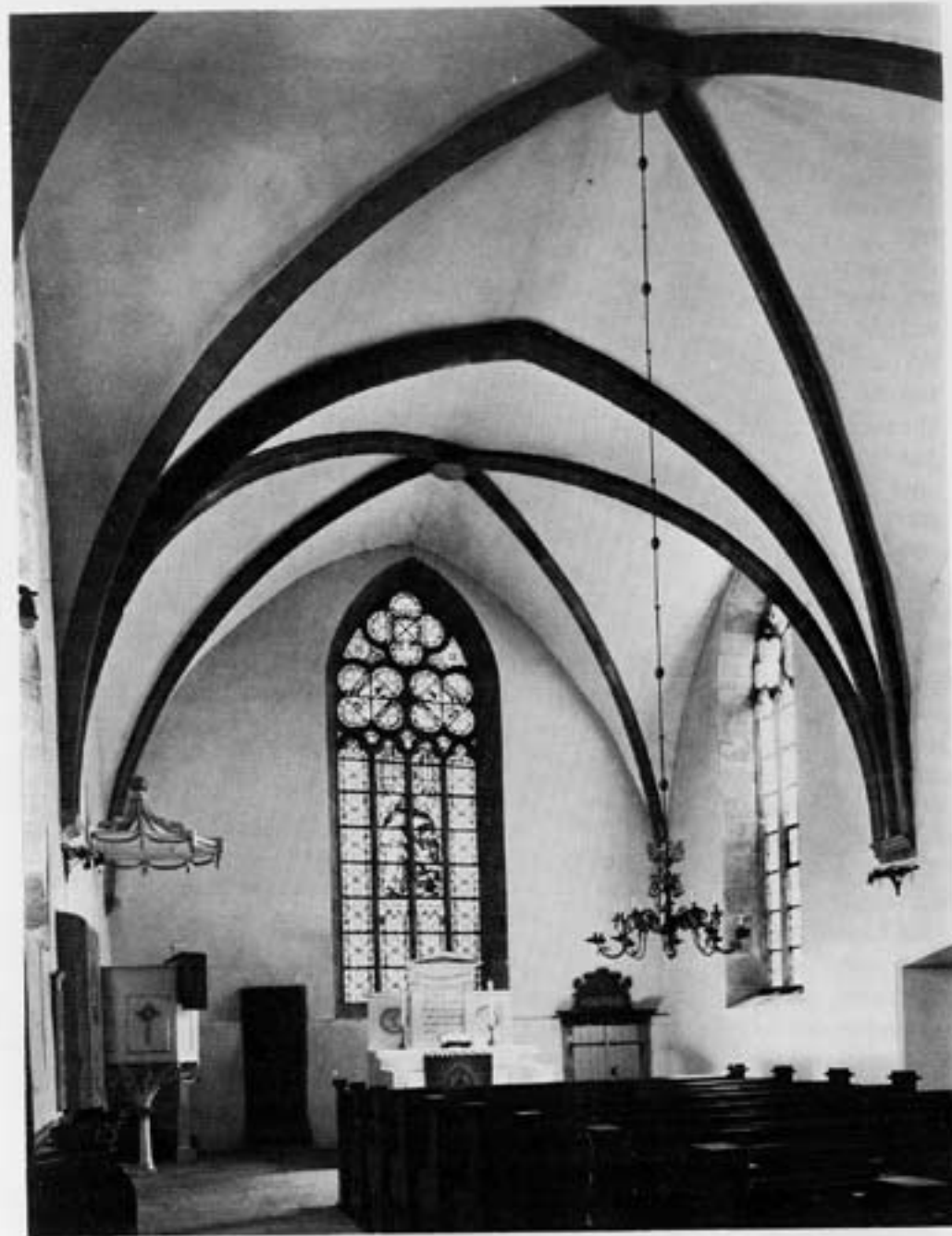
Innenansicht der Kirche nach Osten

Konvent und Kirche werden über die hohe Freitreppe auf der Nordseite des barocken Neubaus betreten. Sie führt uns in einen Gang, der in Höhe der ehemaligen Nonnenempore alle vier Flügel des Konventshofes umzieht. Der jetzt zum Gottes-