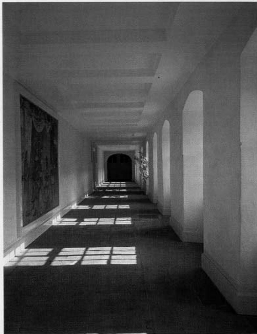
Blick in den Kloostergang

Alle Gebäude des Wiederaufbaues von 1729 – 1740 bestehen aus Bruchstein. Sie waren ursprünglich verputzt und weißlichgelb mit Kalk getüncht. Die Zutaten des 19. Jahrhunderts sind am verwendeten Ziegelmaterial erkennbar. Der Entenpfuhl, hohe Bäume und die huckelige Platzfläche geben dem Ganzen einen romantischen Anstrich.