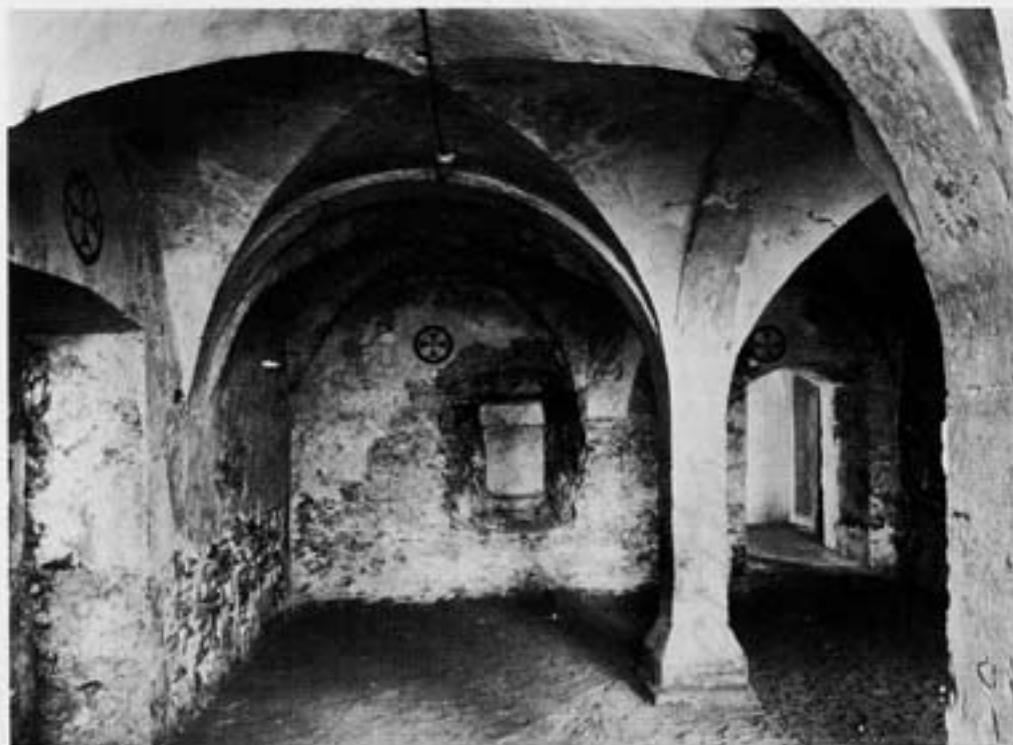
Westteil der Unterkirche

reits im Calenberger Kloster Mariensee 1726 verwirklicht. In gleichartiger Weise, wenn auch bescheidener und unvollendeter, prägt die Gestaltungsform des Vierecks auch die anderen Calenberger Klöster Barsinghausen, Marienwerder und Wennigsen.