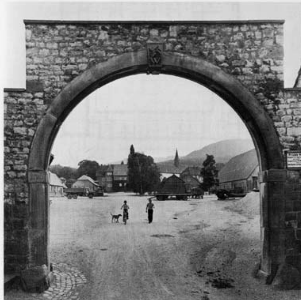
Blick in den Klostergutshof von Norden

Die Betrachtung des Grundrisses macht deutlich, daß sich die ursprünglichen zwölf Wohnungen der Konventualinnen in der Form zweigeschossiger Reihenhäuser um den Innenhof gruppieren. Jeweils zwei von ihnen werden von einem Treppenhaus erschlossen, wobei die besonders große Wohnung der Äbtissin und eine zweite am Nordeingang eine Ausnahme bilden. Neben der Äbtissin-Wohnung im Südflügel liegt der eigentliche Hauptzugang zum Kloster. Die einzelnen Wohnungen sind über den im Erdgeschoß umlaufenden „Kloster“ gang erreichbar. Eine vom Keller bis zum Dach durchlaufende Wand trennt die Wohnungen voneinander. Im Erdgeschoß liegen die Wirtschaftsräume mit der ehemaligen Küche, von der man in den Keller gelangt. Im oberen Geschoß reichen die Wohnräume von Außenwand zu Außenwand. Alle Wohnungen wurden in den letzten Jahren den heutigen Bedürfnissen angepaßt, die der Äbtissin geteilt. Als Konventssaal dient der große Wohnraum der Äbtissin.