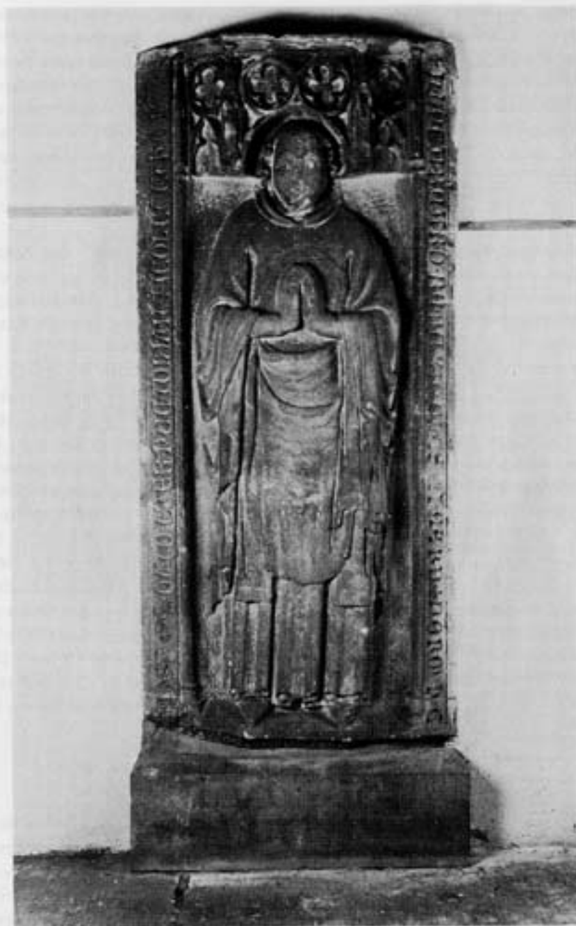
Epitaph des Propstes Bernhard von 1358

Der Westteil der mittelalterlichen Kirche teilt sich — wie bereits gesagt — in zwei