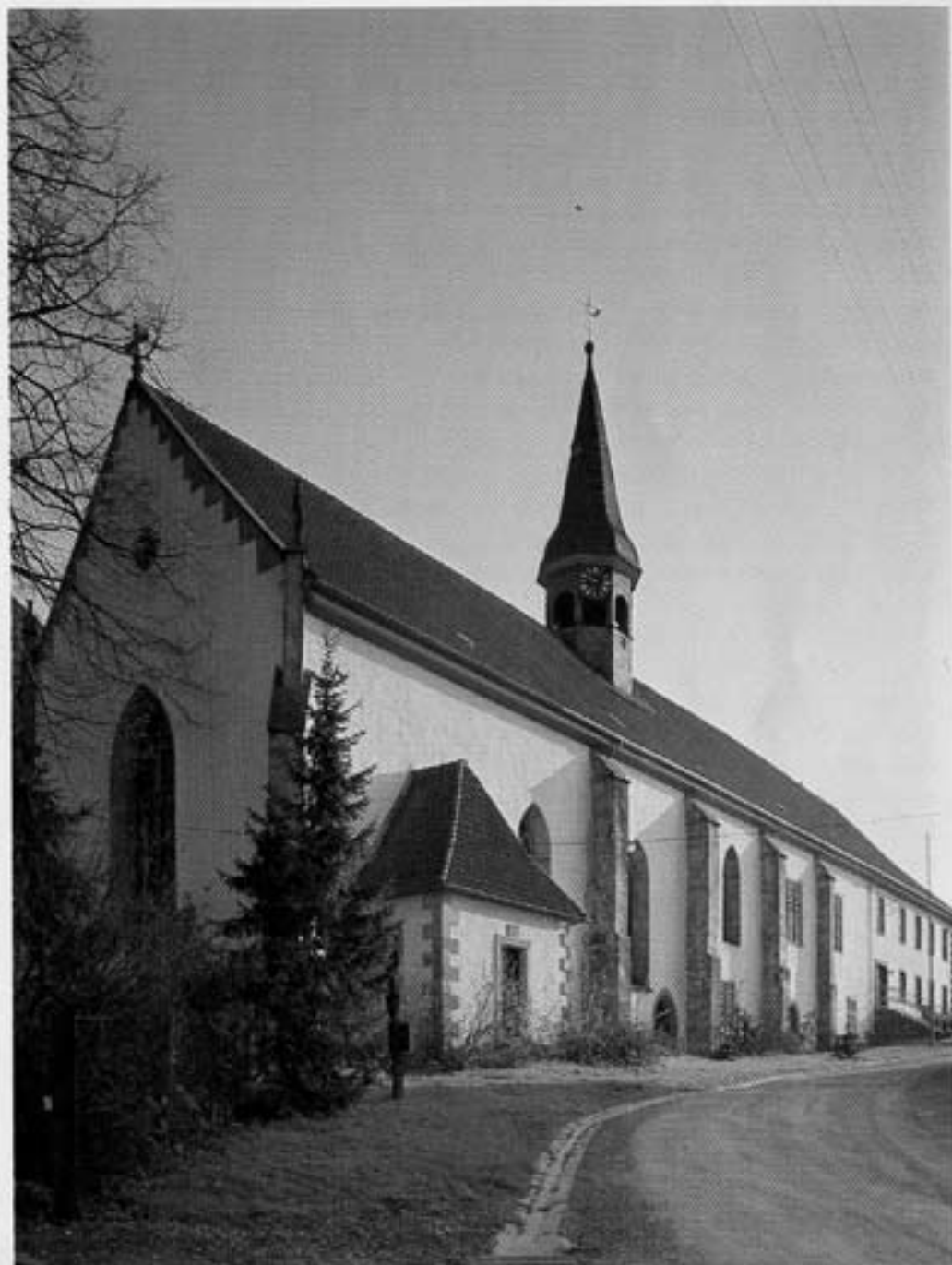
Nordansicht der Klosterkirche

Zu allem Unglück brannte das Kloster auch noch während der welfisch-hildesheimischen Fehde am 8. Januar 1378 ab. Nur mühsam erfolgte ein Wiederaufbau. Rund