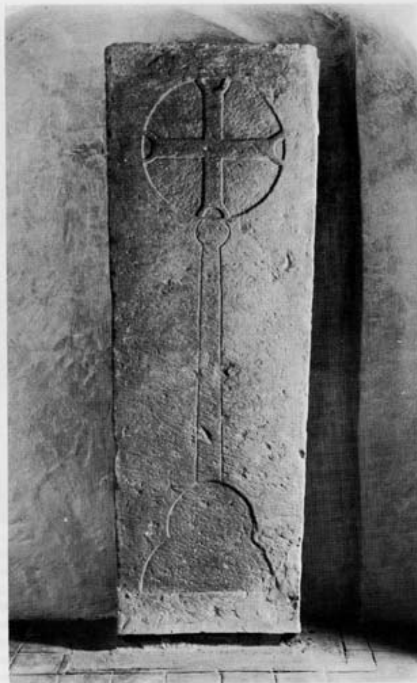
Grabplatte eines Priesters Ende 13. Jh.

Die Konventsgebäude schließen sich in der bereits erwähnten Form im Westen und im Süden an die alte Klosterkirche an. Die durchweg zweigeschossigen Flügel sind im Bereich der Kirche um ein Geschoß versetzt. Diese Situation ist aber nur vom Innenhof voll sichtbar. Hier setzt die unregelmäßige Gestalt der Klosterkirche mit Giebel und Dachreiter einen besonderen Ton zur Regelmäßigkeit der übrigen drei Flügel. Dieser Rhythmus als Zeichen barocker Kraft und Machtentfaltung ist das Hauptkennzeichen des Klosters Wülfighausen. Es wurde in ähnlicher Großzügigkeit be-